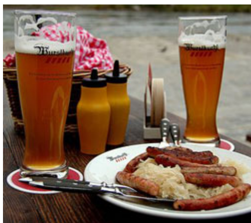
Feste e sagre

Le ferie le avete già fatte e ormai dimenticate, la salute o le finanze quest'anno non vi permetteranno di partire, in vacanza ci andrete ma non subito: sono tanti i motivi che ci trattengono ancora in città. Se dunque non siete tra quei tredici milioni di italiani in viaggio – o meglio dire in coda – e cercate qualche proposta per il caldo fine settimana in arrivo, seguitemi nel nostro “piccolo” viaggio in provincia e dintorni, alla ricerca di quanto c'è di meglio da fare in città, anche ad agosto.