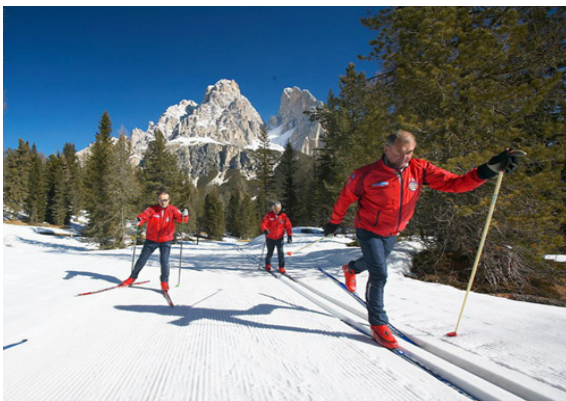
Sci, al via la stagione

Le neviccate degli ultimi giorni hanno dato il via ad una stagione sciistica che sembra promettente: ecco dove si può già sciare vicino o lontano da casa.