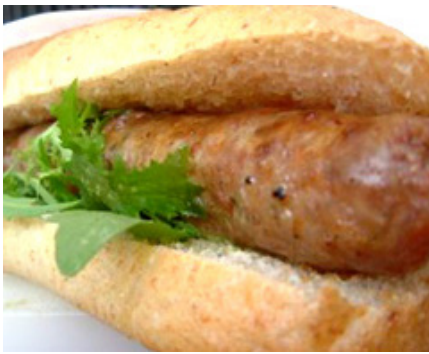
Ferragosto in tavola

Chissà quante volte l'abbiamo detto o sentito dire: ma è possibile che da noi, anche ad agosto, il piatto forte sia sempre la polenta ? E che ci volete fare? Fossimo al mare sulla griglia sfrigolerebbe dell'ottimo pesce spada, ma se lanciassimo un sondaggio tra gli agostani di città , non troveremmo nessuno che non abbia mai ceduto al richiamo di un bel piatto gustoso e fumante di gialla o taragna . Complici le temperature che qui, anche a Ferragosto , non sono mai da solleone e che anche quest'anno saranno gradevoli, ma non certo afose . E dunque strada ancora una volta spianata per zola e bruscitt , da assaggiare rigorosamente in una delle tante feste che a Ferragosto animano laghi, spiagge e cime della Provincia.