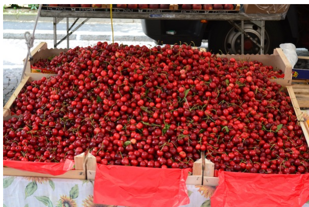
A Gavirate c'è l'ultimo fine settimana per fare una

Alla Rasa c'è la seconda notte bianca organizzata dal comune di Varese. Dalle 20 alla 1 ci saranno una serie di appuntamenti sui temi della sicurezza tenuti dalla forze dell'ordine.