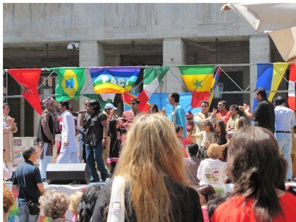
Mylius e la zona della Brunella.

Domenica invece, ai Giardini Estensi c'è "3° Memorial Luca Miraglia – raduno auto d'epoca Alfa Romeo" con 55 auto, che saranno esposte in parte nel cortiletto d'onore in parte nella zona della tensostruttura. Le auto lasceranno i Giardini Estensi alle ore 12 e imboccheranno le via Sacco e Sanvito per il trasferimento a Laveno Monbello. Qui saranno posizionate in piazza Matteotti e davanti all'attracco dei traghetti.