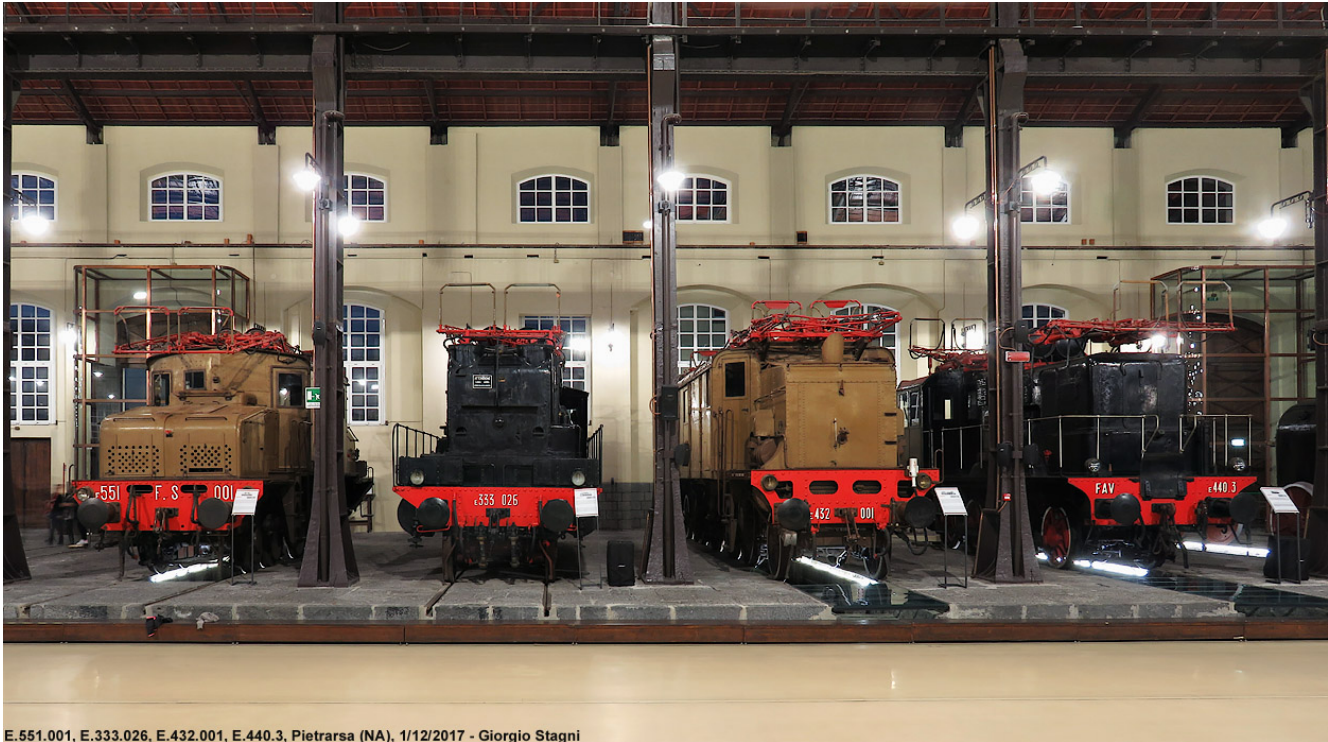
E.551.001, E.333.026, E.432.001, E.440.3, Pietrarsa (NA), 1/12/2017 - Giorgio Stagni

Le locomotive elettriche trifasi al museo ferroviario nazionale di Pietrarsa, a Napoli: la seconda e la quarta, quelle dipinte in nero, sono state costruite a Saronno (foto: Stagniweb )