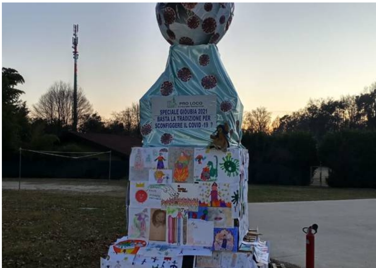
La gioebia casoratese coperta di disegni

A Lonate Pozzolo la Pro Loco ha invece moltiplicato le gioebie : non una sola da vedere a distanza, ma tante gioebie “domestiche” , che hanno accompagnato il tradizionale cinin consegnato a casa. All’inizio si pensava a una candela, ma alla fine nelle case dei lonatesi è arrivata una piccola “fontana” pirotecnica da mettere sul tavolo, per simulare l’effetto del fuoco della gioebia che divampa . Accanto, un menù che comprendeva ovviamente il piatto tradizionale del cinin , salamit e fasurit : la Pro Loco ha consegnato ben 170 porzioni.