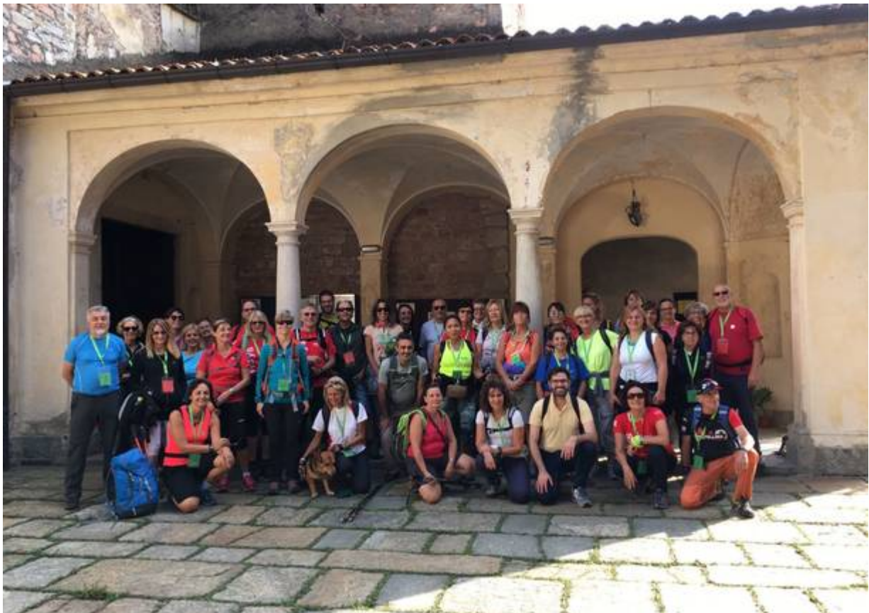
La foto dei primi pellegrini

Nella mattinata di sabato 23 settembre è partito da Ponte Tresa, dove inizia il cammino al confine con la Svizzera, il primo gruppo di pellegrini italiani e svizzeri della Via Francisca del Lucomagno LEGGI L'ARTICOLO .