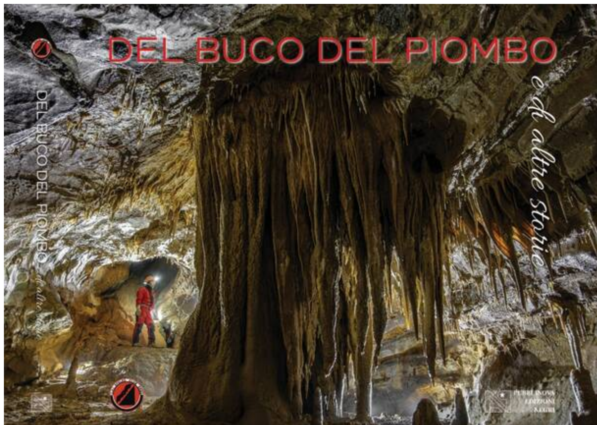
Un tratto di galleria nell'abisso della Scondurava

L'appuntamento per fare luce sui vuoti sotterranei delle prealpi lombarde è quindi Venerdì 27 marzo dalle ore 21 presso la sede del CAI Tradate (Largo ai paracadutisti d'Italia, angolo via Ciro Menotti).